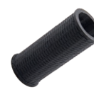
Органы управления, рукоятки