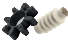
Демпферы, в т.ч. эластичные муфты