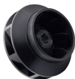
Рабочие колёса насосов