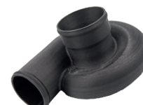
Корпусные детали, крышки